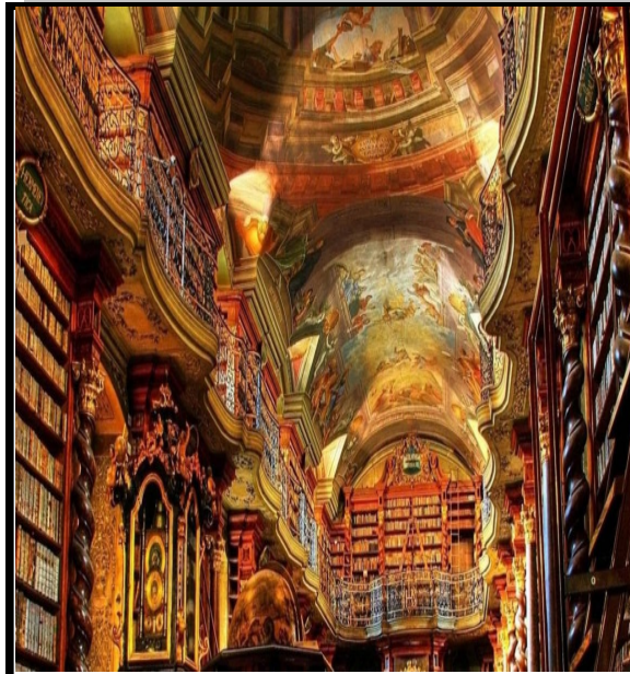
کتابخانه‌های دیدنی اروپا