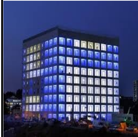
نمای بیرونی کتابخانه شهر اشتوتگارت آلمان

می‌کنند. ضوابط بخش فهرست‌نویسی و رده‌بندی به منظور هماهنگی با سایر کتابخانه‌ها است.