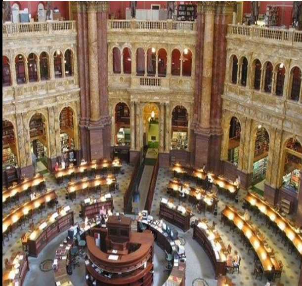
تصویری از کتابخانه‌های زیبای جهان